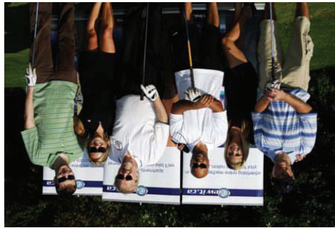
Tournoi annuel de golf CLV, où nous partageons les fonds avec d'autres organisations; permet de réunir des fonds de 10 000 $