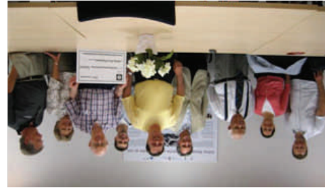
Soirée italienne, souper et dons de 62 000 $ de la communauté italienne, en plus des bourses d'études susmentionnées.

LE CRM est extrêmement reconnaissant pour le soutien qu'on reçoit de la communauté. En 2009, un nombre de campagnes communautaires ont réuni des fonds pour les recherches au CRM.: